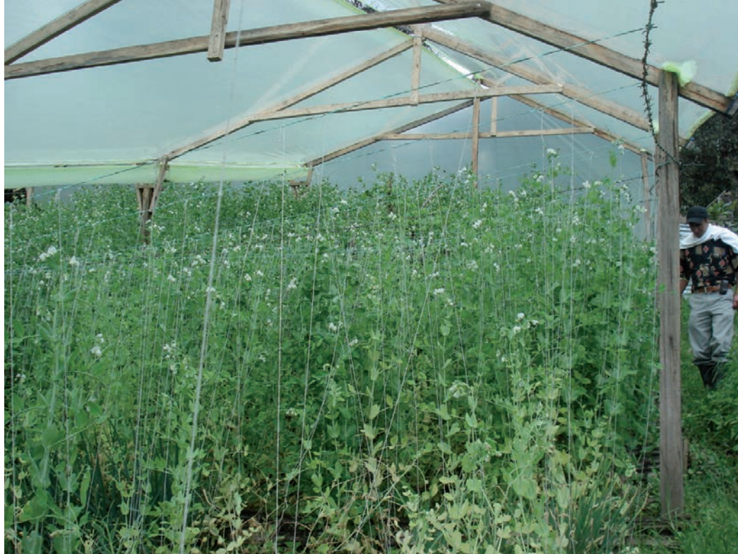
Cultivos bajo cubierta.

La Unillanos ha entendido que para estar de "cara a la sociedad", se requiere persistencia, mucha humildad, recursos y voluntad para que el propósito que guía el conjunto de la actividad unillanense en la región se materialice con esfuerzos como el reseñado.